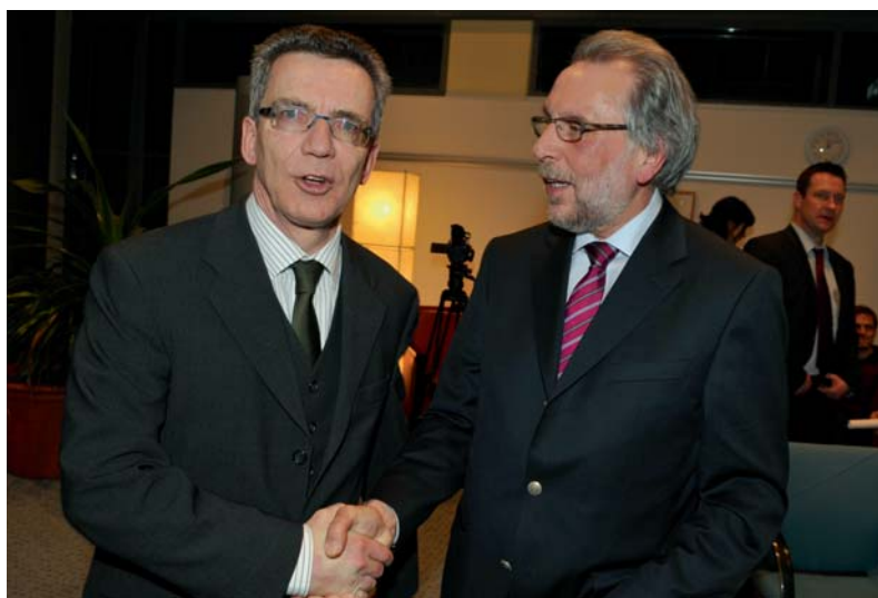
Bundesinnenminister Thomas de Maizière und dbb-Verhandlungsführer Frank Stöhr nach dem Abschluss der Tarifverhandlungen

Die Ausbildungs- und Praktikantenentgelte werden entsprechend erhöht. Zusätzlich erhalten Azubis und Praktikanten im Januar 2011 eine Sonderzahlung von 50 Euro. Weiterhin werden die Garantiebeträge bei Höhergruppierungen rückwirkend ab Januar 2010 erhöht. Für Höhergruppierungen ab dem 1. Januar 2010 wird der Garantiebetrug nach § 17 Abs. 4 TVöD in den Entgeltgruppen 1 bis 8 von 30 auf 50 Euro angehoben. Für Höhergruppierungen in den Entgeltgruppen 9 bis 15 beträgt der Garantiebetrug statt bisher 60 Euro nunmehr 80 Euro.